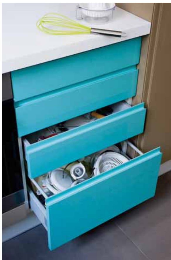
Les tiroirs offrent une prise de main sans poignée, afin de ne pas briser l'effet graphique des rayures.

Teintes fraîches et gourmandes sur fond blanc et bandes verticales pour créer du rythme : cette cuisine est traitée façon haute couture.